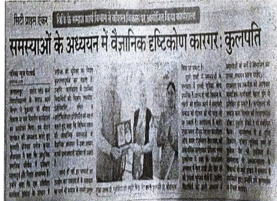
पत्रिका न्यूज़ पेपर